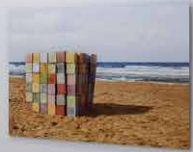
Yetişkinler İçin Oyun Blokları | Color Blocks For Adults, 2014 Sergi Görsele | Exhibition View