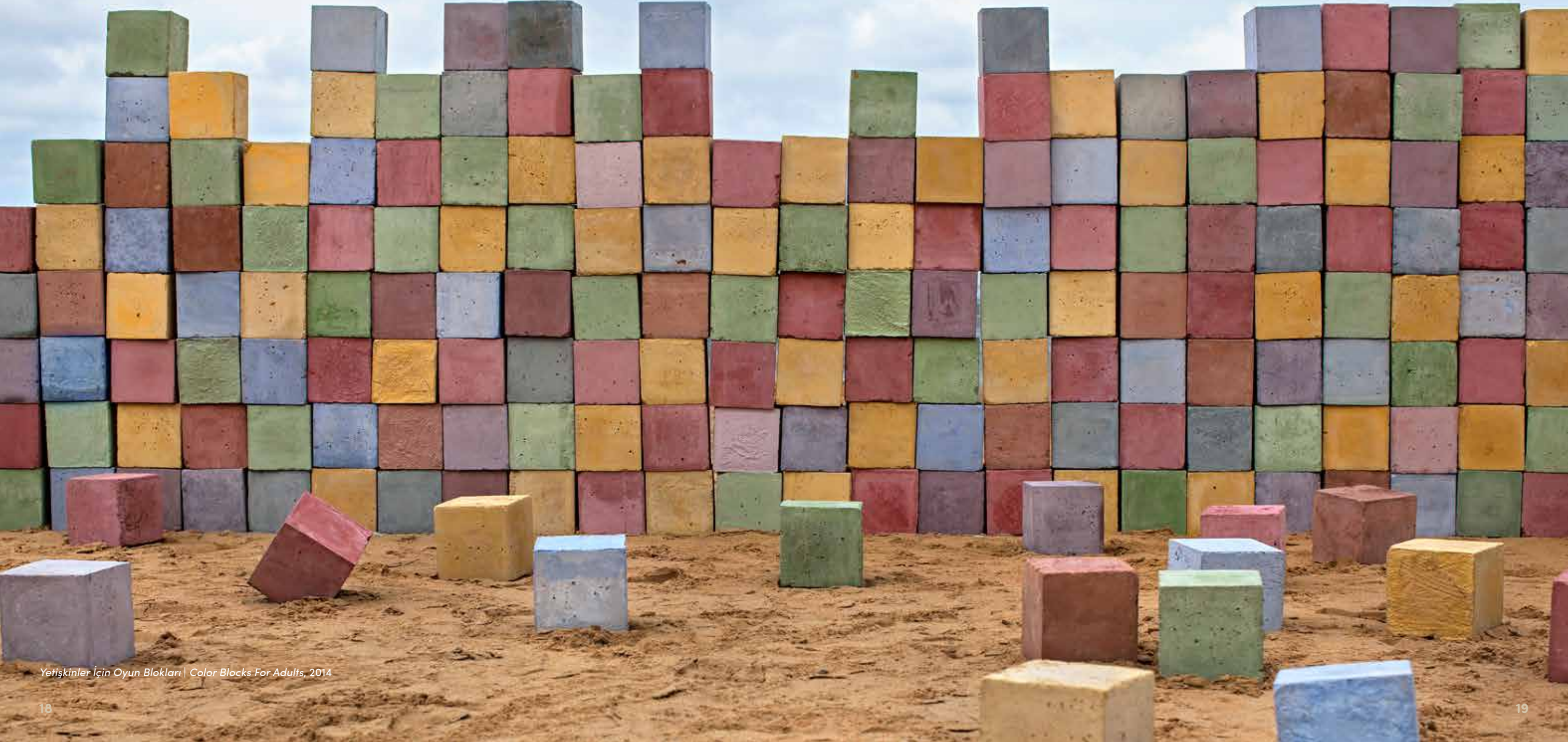
Yetişkinler İçin Oyun Blokları | Color Blocks For Adults, 2014