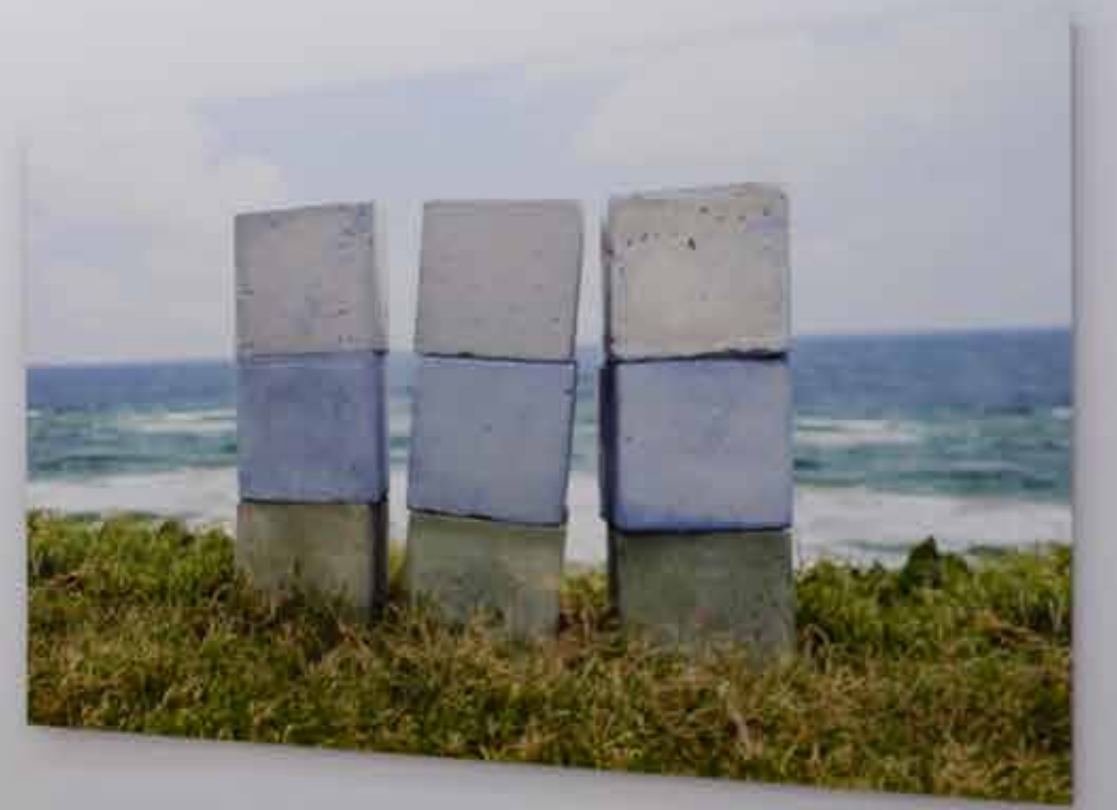
Yetişkinler İçin Oyun Blokları | Color Blocks For Adults, 2014 Sergi Görseli | Exhibition View