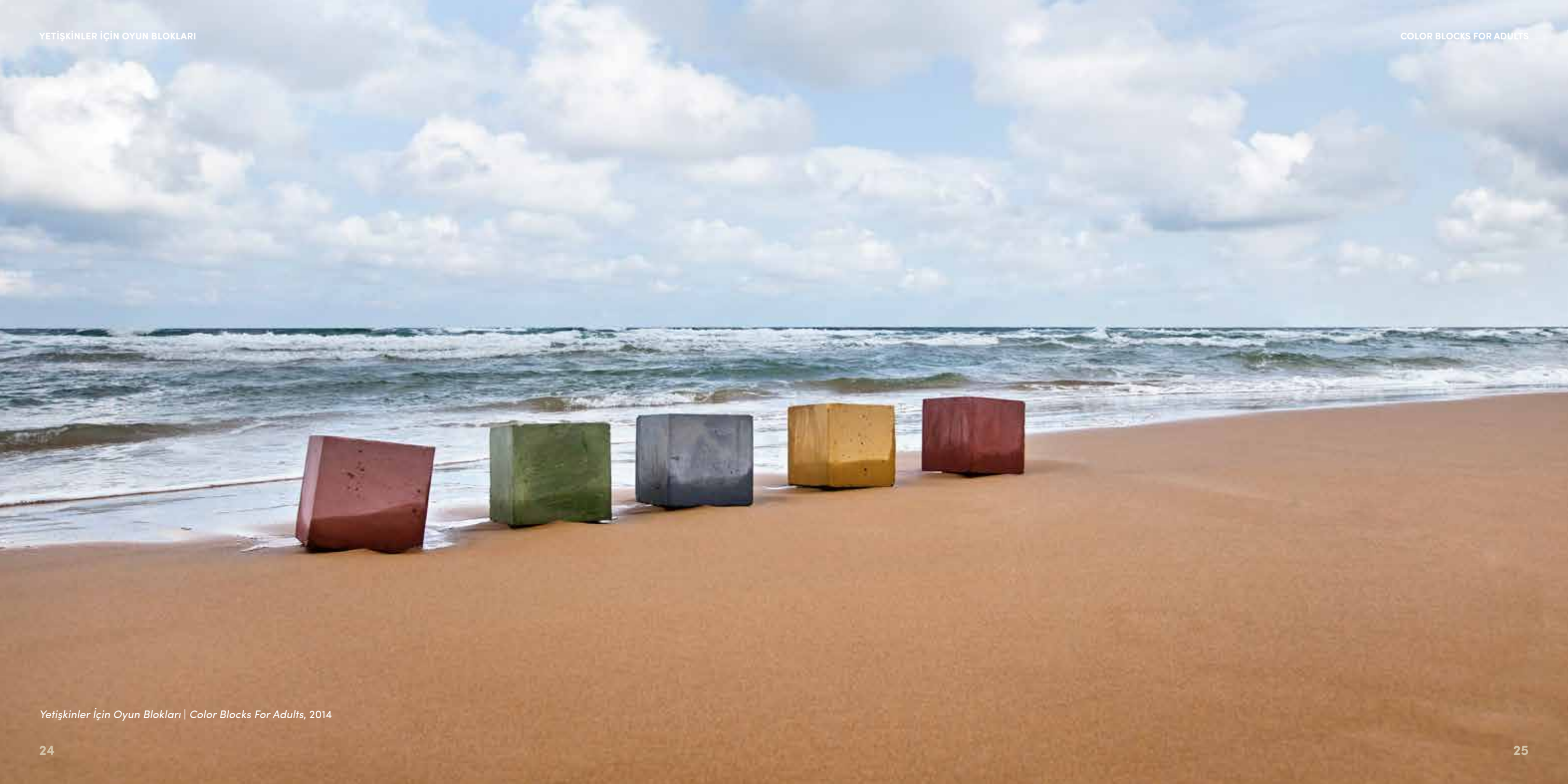
Yetiřkinler İin Oyun Blokları | Color Blocks For Adults, 2014