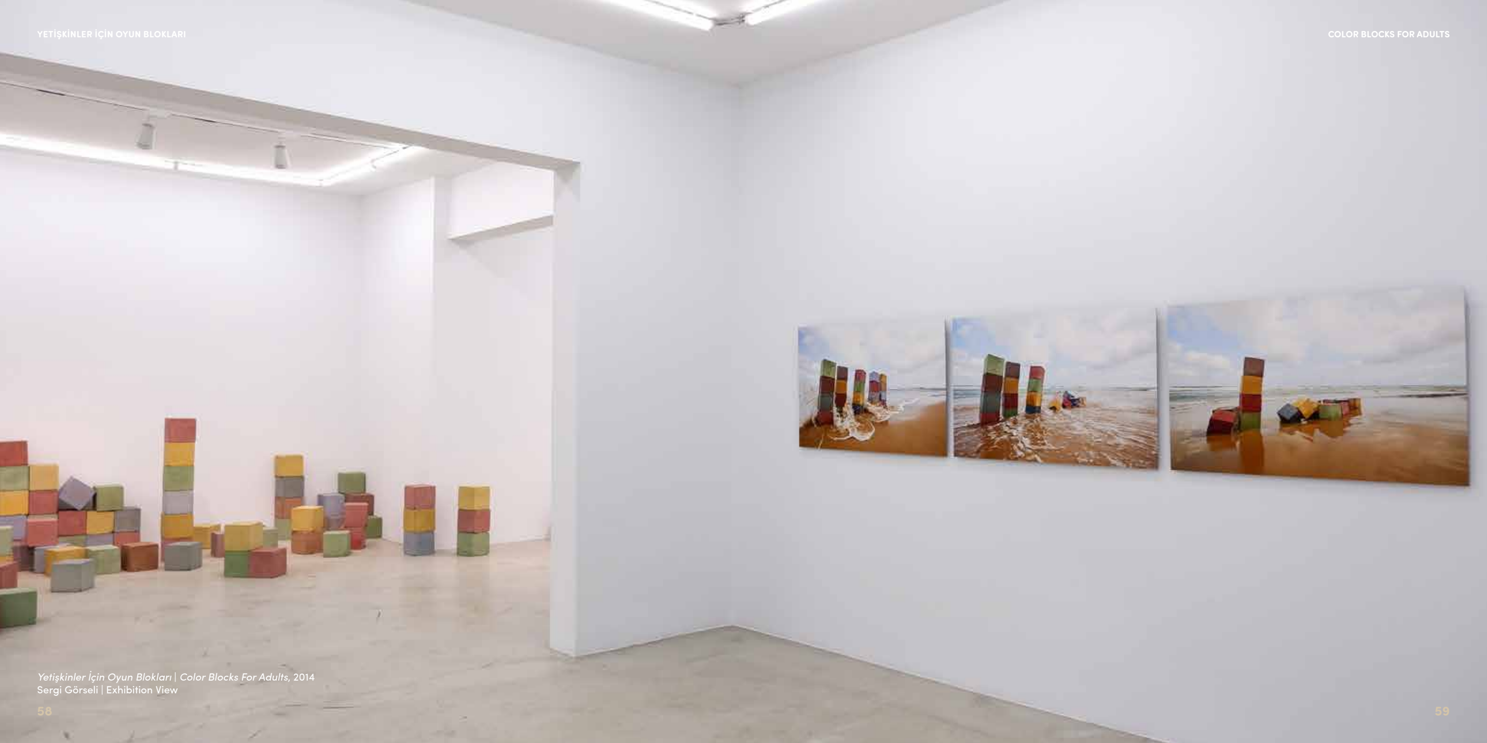
Yetişkinler İçin Oyun Blokları | Color Blocks For Adults, 2014 Sergi Görself | Exhibition View