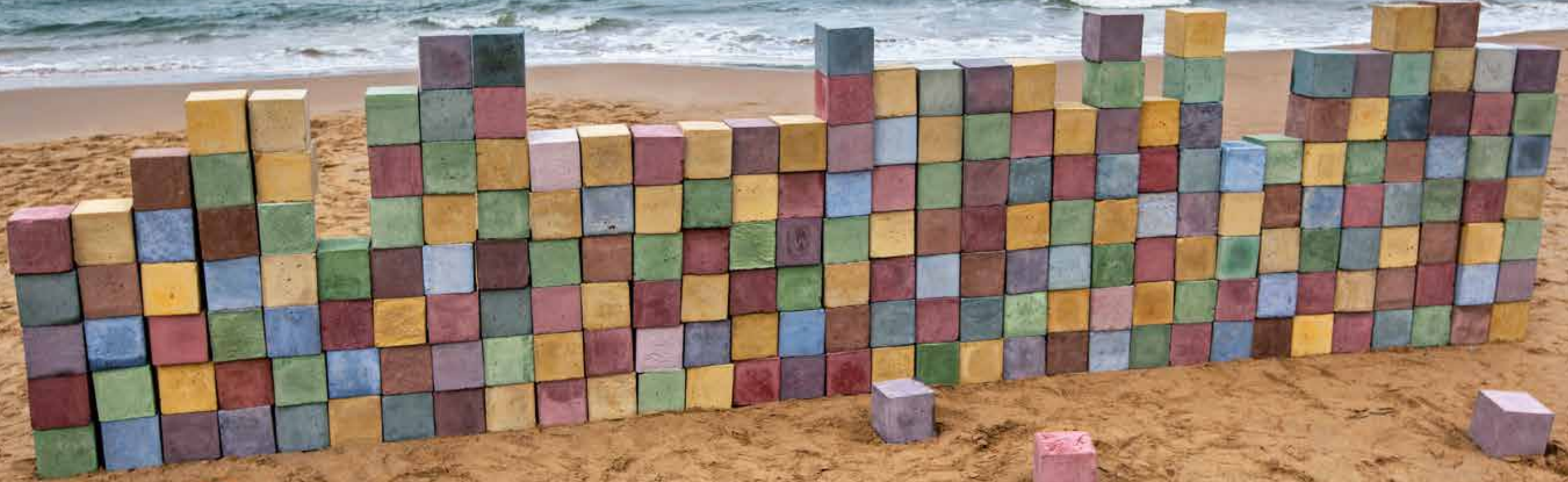
Yetişkinler İçin Oyun Blokları | Color Blocks For Adults, 2014