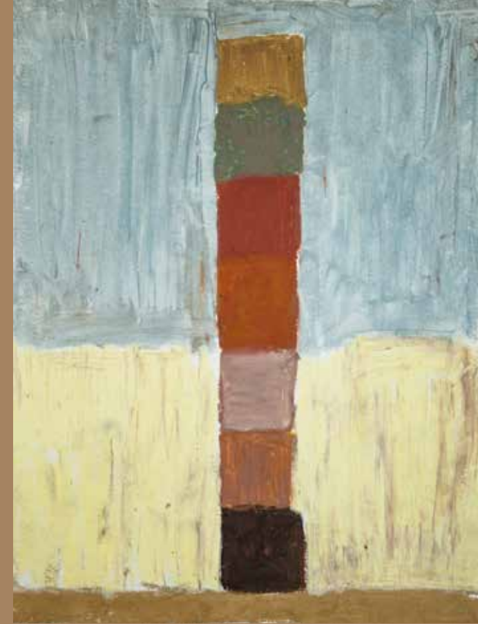
Eskiz | Sketch, 2012

Ziyaret Saatleri | Visit Hours Monday - Friday 11:00-19:00 / 11am-7pm