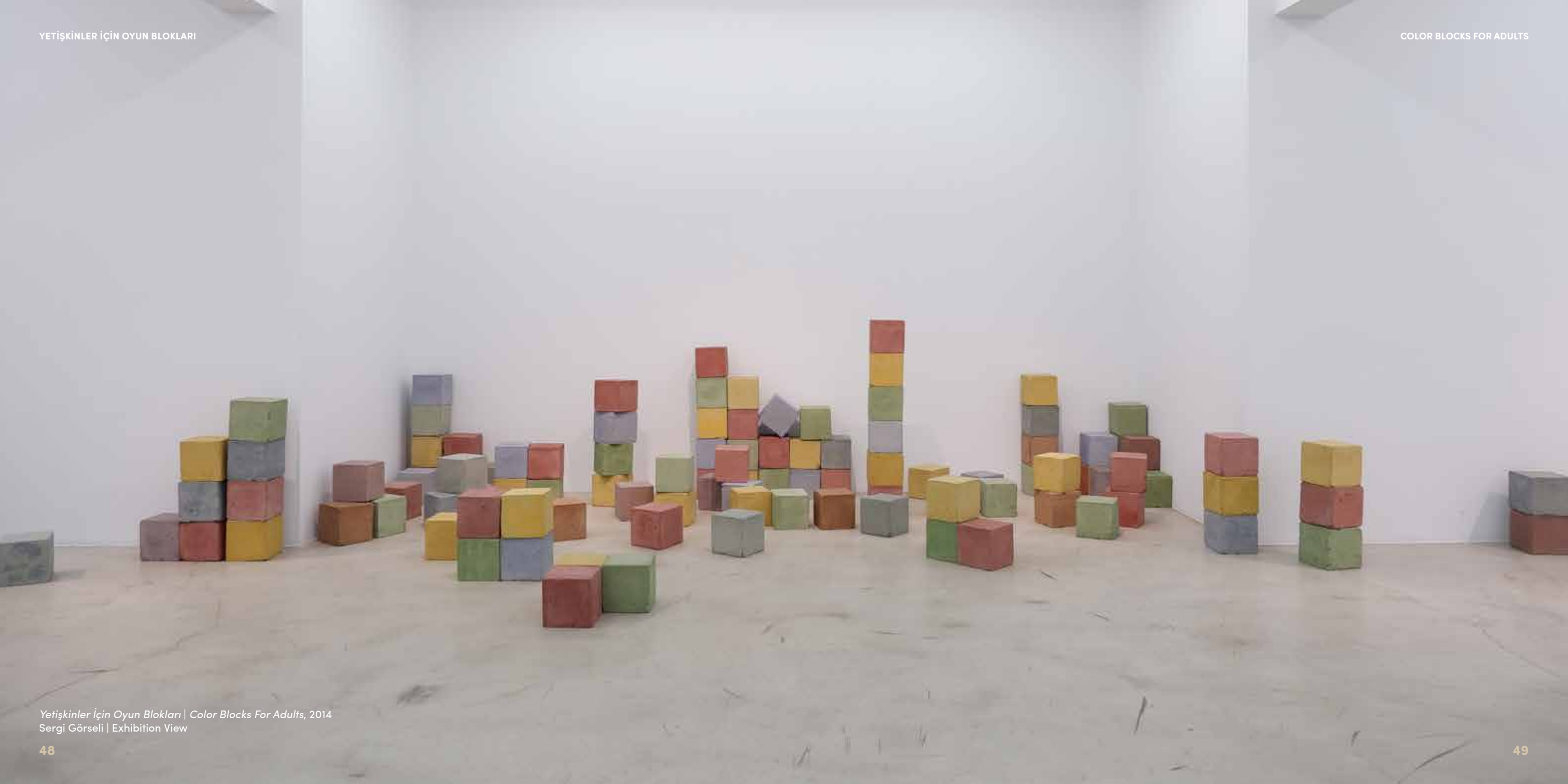
Yetiřkinler İin Oyun Blokları | Color Blocks For Adults, 2014 Sergi Grseli | Exhibition View