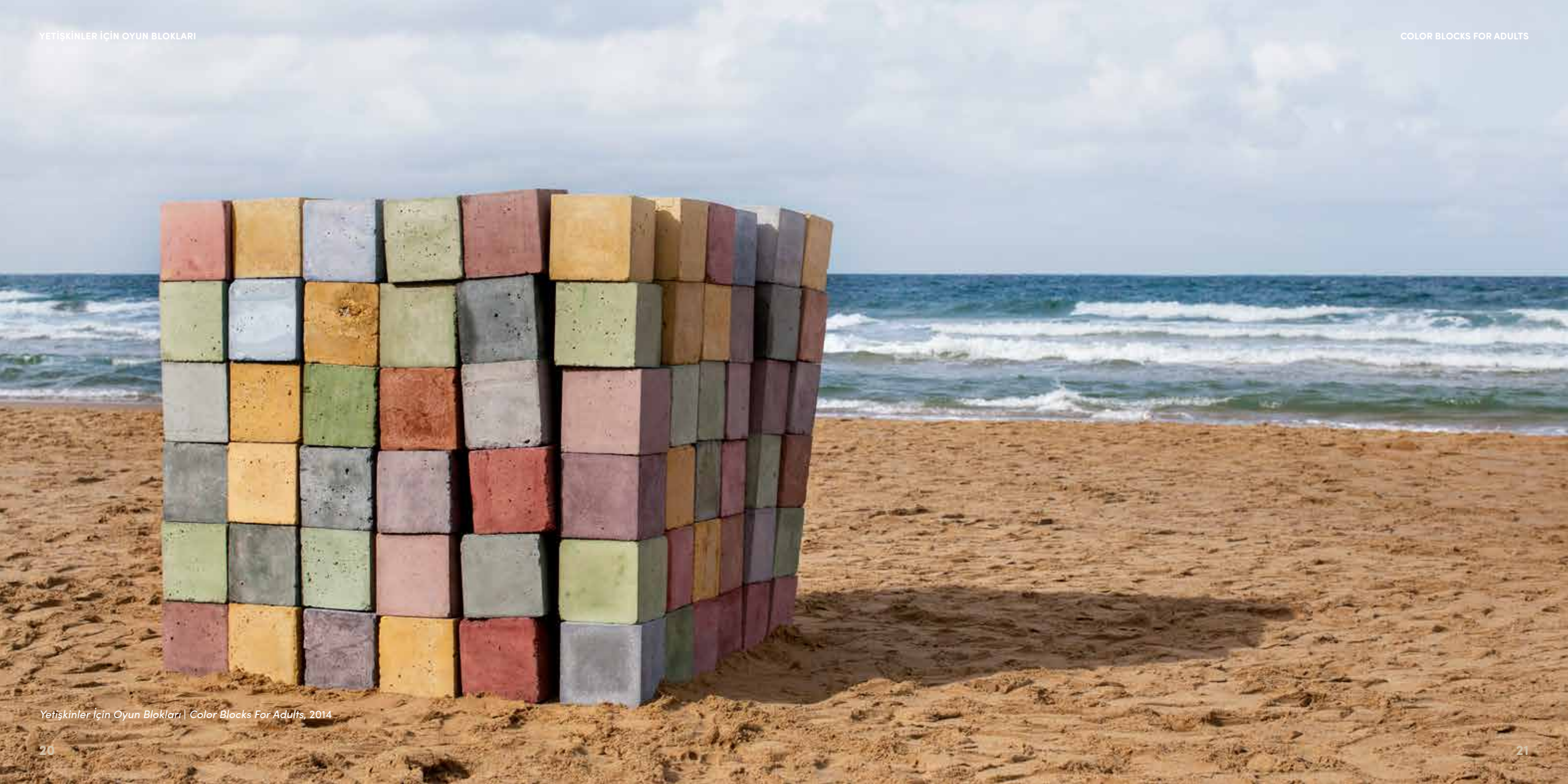
Yetiřkinler İin Oyun Blokları | Color Blocks For Adults, 2014