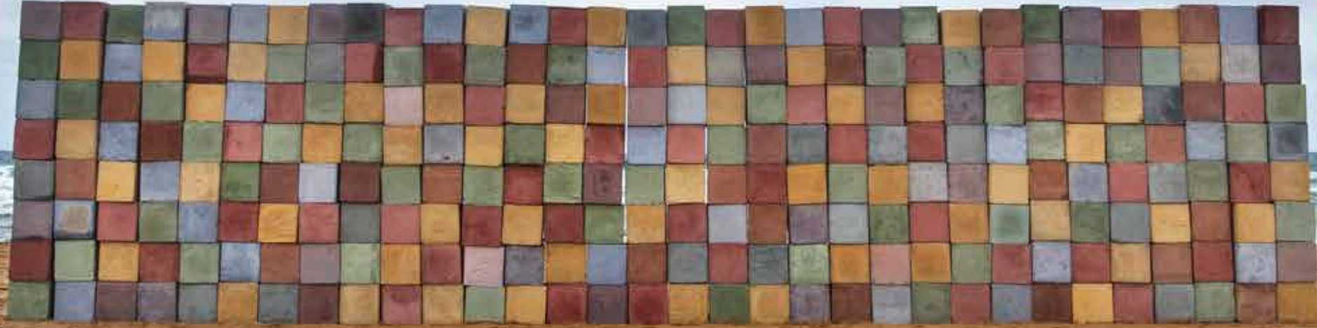
Yetiřkinler İin Oyun Blokları | Color Blocks For Adults, 2014